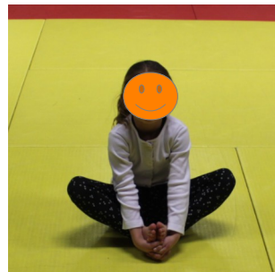
Toupie - Papillon