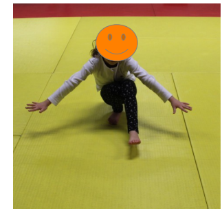
1 pied droit