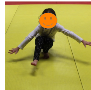
1 pied gauche